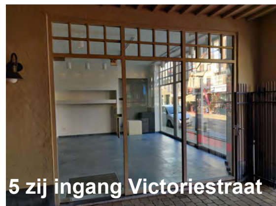
5 zij ingang Victoriestraat