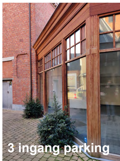
3 ingang parking