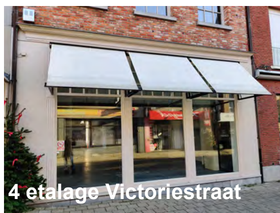
4 etalage Victoriestraat